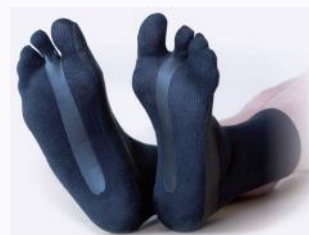
Tabisocke mit zwei separaten Zehen und außenliegenden Tapes bei Hammerzehe

Materialzusammensetzung: 90% Baumwolle • 9% Polyamid • 1% Elasthan