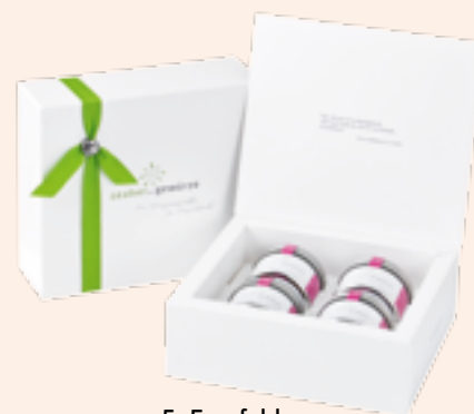
5. Empfehlung Seite 17