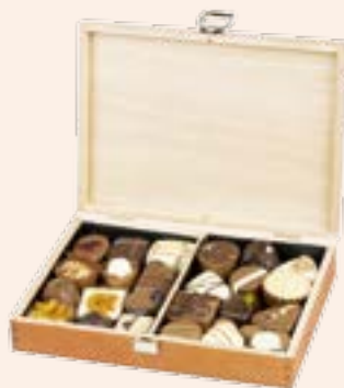
4. Empfehlung Seite 9