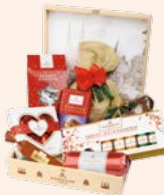
2. Empfehlung Seite 8