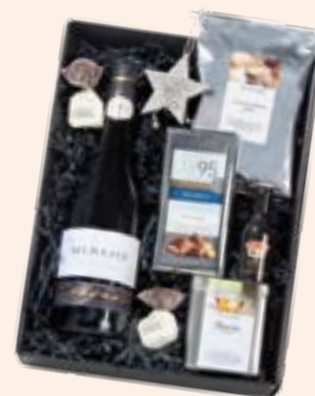
3. Empfehlung Seite 15