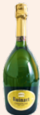
1. Empfehlung Seite 10

Ihre Antwort können Sie uns mit dem in diesem Katalog beigegefügte Bestellformular per Fax zukommen lassen.