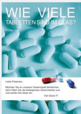
- A4 Informationsblatt -