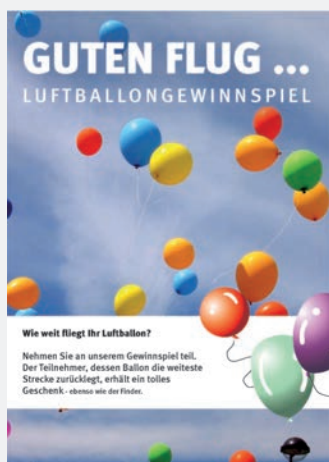
- A4 Informationsblatt -