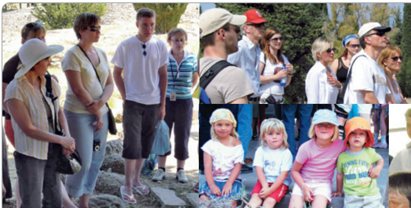
Seminar + Besuch Asklepieion

„Bei der ersten Anmeldung fiel es meiner Frau und mir schwer uns anzumelden. Der Vorlesungsblock ist nicht zu verachten. Morgens um 9 Uhr geht es los. Für uns war es unvorstellbar, eine Weiterbildung auf Kos und dann so viel Stoff. Wir wurden aber positiv überrascht. Die Organisation der Reise, die Veranstaltungen vor Ort, alles war sehr durchdacht, alle Punkte bis ins Detail geplant. Die Referenten haben uns mit ihrem Fachwissen, ihrem