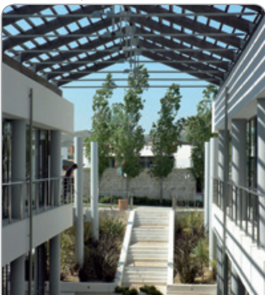
Seminarzentrum „Neptune Hotel“